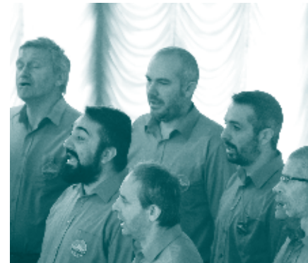
Coro Cima d'Oro Valle di Ledro - "Pigarelli" 2019