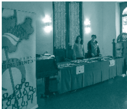
Segreteria - "Pigarelli" 2017

Durante tutte le giornate del concorso il Teatro Comunale di Pergine sarà aperto al pubblico gratuitamente fino a esaurimento dei posti disponibili. Per la serata di gala di Sabato sera e la fase finale di domenica pomeriggio è consigliata la prenotazione attraverso il sito della Federazione Cori del Trentino www.federcoritrentino.it