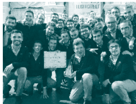
Coro CET - Canto e tradizione - “Pigarelli” 2019