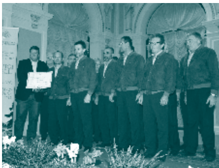
Coro Cima Tosa Valli Giudicarie - “Pigarelli” 2015