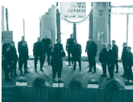
Gruppo Vocale Novecento - “Pigarelli” 2017