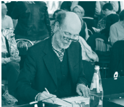
Giurato - "Pigarelli" 2015