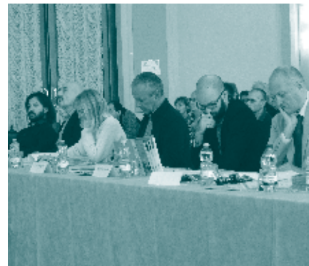
Lavori di giuria - "Pigarelli" 2015