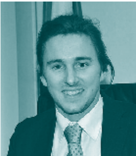
Mirko Bisesti Assessore all’istruzione, università e cultura della Provincia Autonoma di Trento

Auguro quindi a tutti una felice partecipazione alla competizione, certo che saprà essere, al di là degli esiti “agonistici”, una magnifica esperienza di amicizia e confronto.