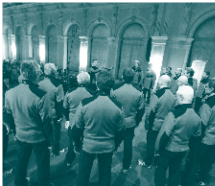
Coro Castel S.A.T. di Arco - "Pigarelli" 2017