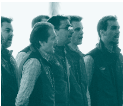
Coro Monte Calisio - "Pigarelli" 2015